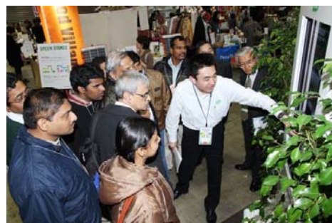
・外国語による会場内ツアー