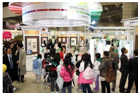
・テーマ展示「生物多様性ゾーン」