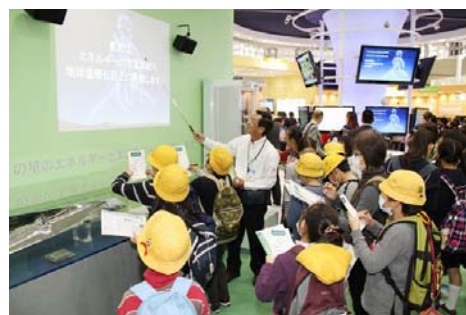
・熱心にメモを取る小学生たち